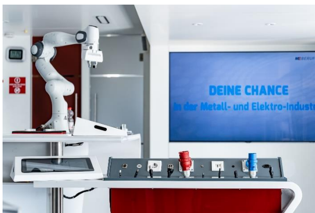
Der neue kollaborativ arbeitende Roboter im M+E-InfoTruck Rückfragen? Wenden Sie sich an: ulm@suedwestmetall.de

M+E-InfoTrucks oft nicht möglich sind, arbeitet das Truck-Team daran, Schulklassen mit einer digitalen Lösung über die Ausbildungsberufe in der M+E-Industrie zu informieren. Darüber hinaus ist geplant, dass die Coaches des M+E-InfoTrucks an digitalen Bildungsmessen teilnehmen, um den direkten Austausch mit den Jugendlichen zu ermöglichen.